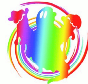
A.S.Cu.S. Associazione Socio-Culturale "lo Spettro"

Il piano è destinato alle azioni di contrasto alla povertà e a rafforzare l'assistenza per le fasce sociali svantaggiate: prevede azioni strutturali e articolate per rispondere alle diverse forme di povertà che si registrano nel Lazio. Il finanziamento supporterà le diciotto associazioni di volontariato che hanno collaborato alla stesura del documento. Polverini: "Il piano guarda agli anziani, ai giovani in difficoltà, alle famiglie che hanno bambini malati oncologici, dà risposte alle mense per i poveri e i centri notturni".